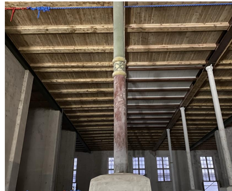
I det gamle Landbrugsmuseum skal der være museum, faciliteter til mærkeklubber og mulighed for at få opbevaret og repareret klassiske biler.