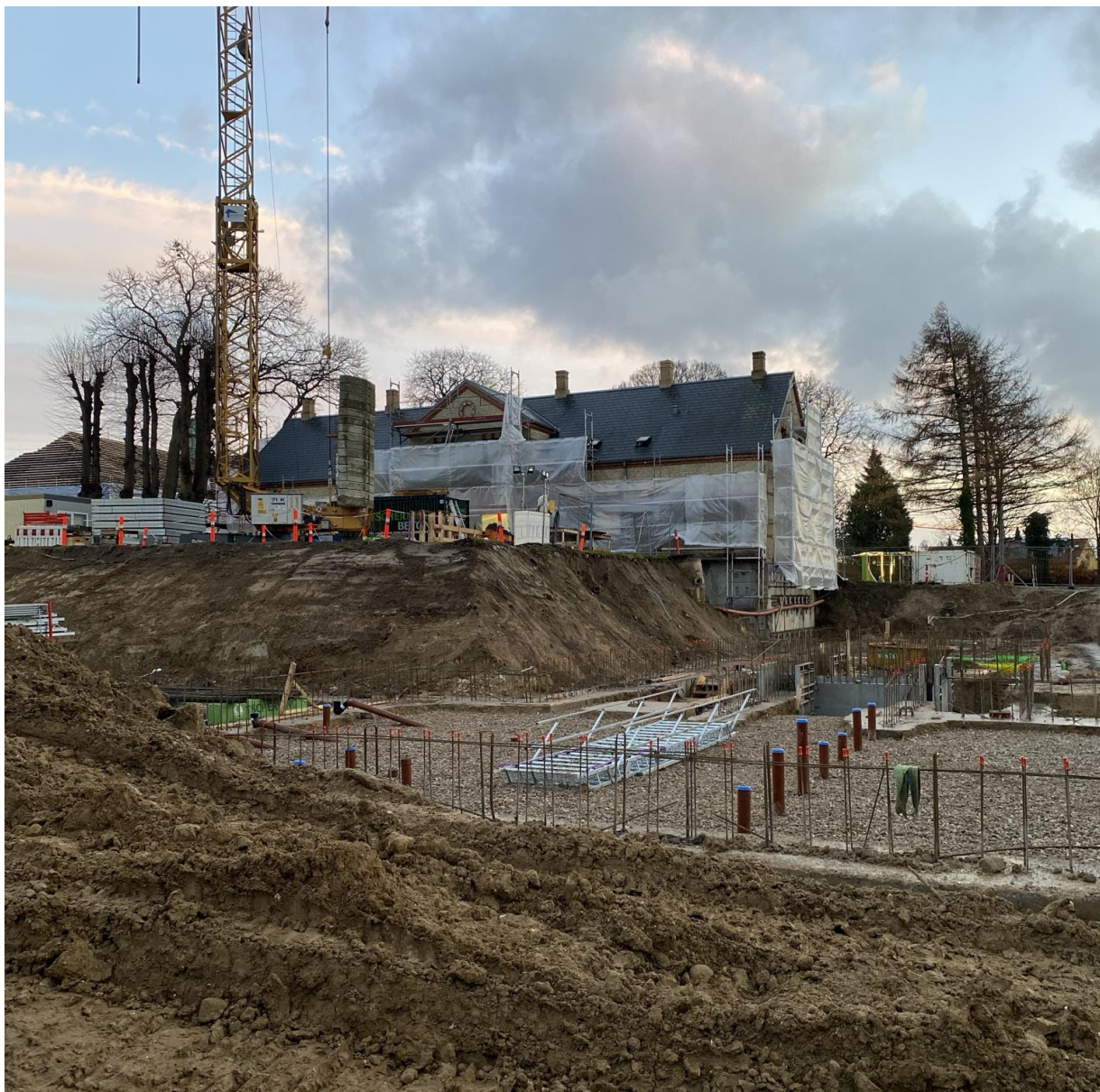
Virumgård skal rumme café, møde- og selskabslokaler.